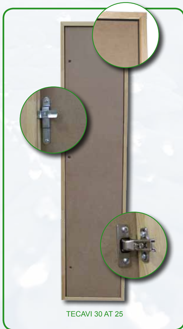
TECAVI 30 AT 25